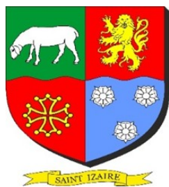
Blason de la commune