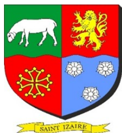
Blason de la commune