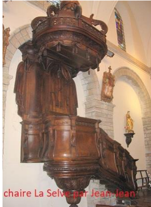
chaire La Selve par Jean-Jean

Quelques réalisations des artisans les plus connus :