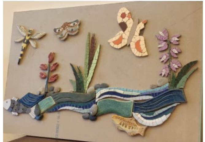
Fresque en céramique qui sera incrustée dans le mur du préau

Deux films réalisés par Clip Clap Prod consignent les avancées du projet. Vous pouvez les visualiser avec les liens suivants : https://www.youtube.com/watch?v=MZ_Pobz6C9s&t=320s https://www.youtube.com/watch?v=oZY_VtQYh6g&t=52s