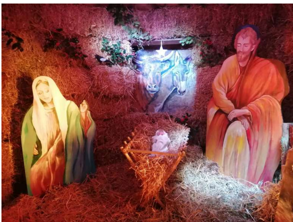
Crèche 2020 de l'église de Pachins réalisée par le Comité des Fêtes.

Merci pour votre lecture et un grand merci à Edith FAIX, rédactrice de ce bulletin L'équipe municipale