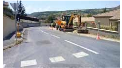
Réfection de trottoirs sur la route de Mayres jusqu'au carrefour de la RD 992.