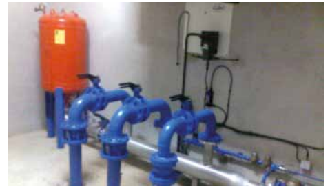
Remise aux normes de certains équipements sur la station de pompage du Boundoulaou.