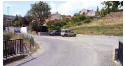
Réalisation d'un nouveau parking avenue Bernard Pottier.