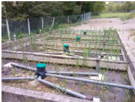
Programme de Réhabilitation des stations d'épuration de Craissac et St-Geniez-de-Bertrand (reprise des ouvrages et transformation des anciens filtres de type compact par des nouveaux filtres type plantés de roseaux).