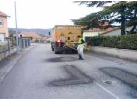
Réparation de voiries sur le village ainsi que sur la route de St-Geniez-de-Bertrand par projection d'enrobé projeté.