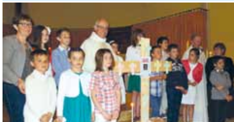
Première communion le dimanche 25 mai en l'église de Saint-Georges

Les activités paroissiales « calées » sur le rythme scolaire viennent de se terminer et on pense déjà à la reprise qui se fera en septembre et octobre.