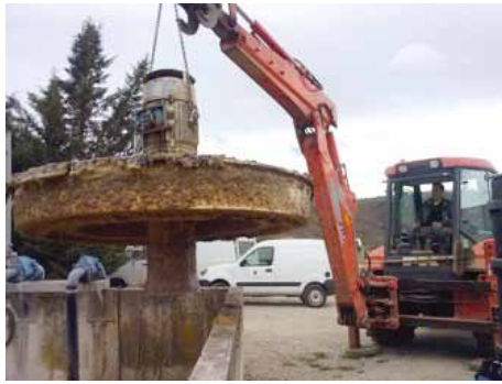
Gros travaux de maintenance sur la station d'épuration.