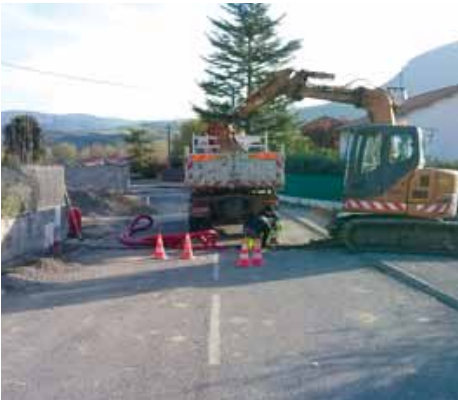
Travaux de dissimulation des réseaux électriques et d'éclairage public (reprise de branchements d'eau potable), dans la rue des Assalisses.