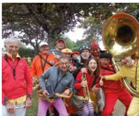
L'Echo des Avens à Rouen

La plupart des fanfares comptent parmi leurs membres des artistes aux multiples talents dont la fabrication de canards n'est qu'un des aspects. Les JAMS 2014 demandent donc à chaque fanfare invitée d'exposer son savoir-faire et ses chefs-d'œuvre (peintures, mécaniques, culinaires, etc...) et de proposer - en musique - des attractions (manèges, jonglage, exhibition de monstres, etc...), inaugurant ainsi la première foire aux fanfares de l'histoire de Saint-Georges-de-Luzençon et peut-être même de l'humanité.