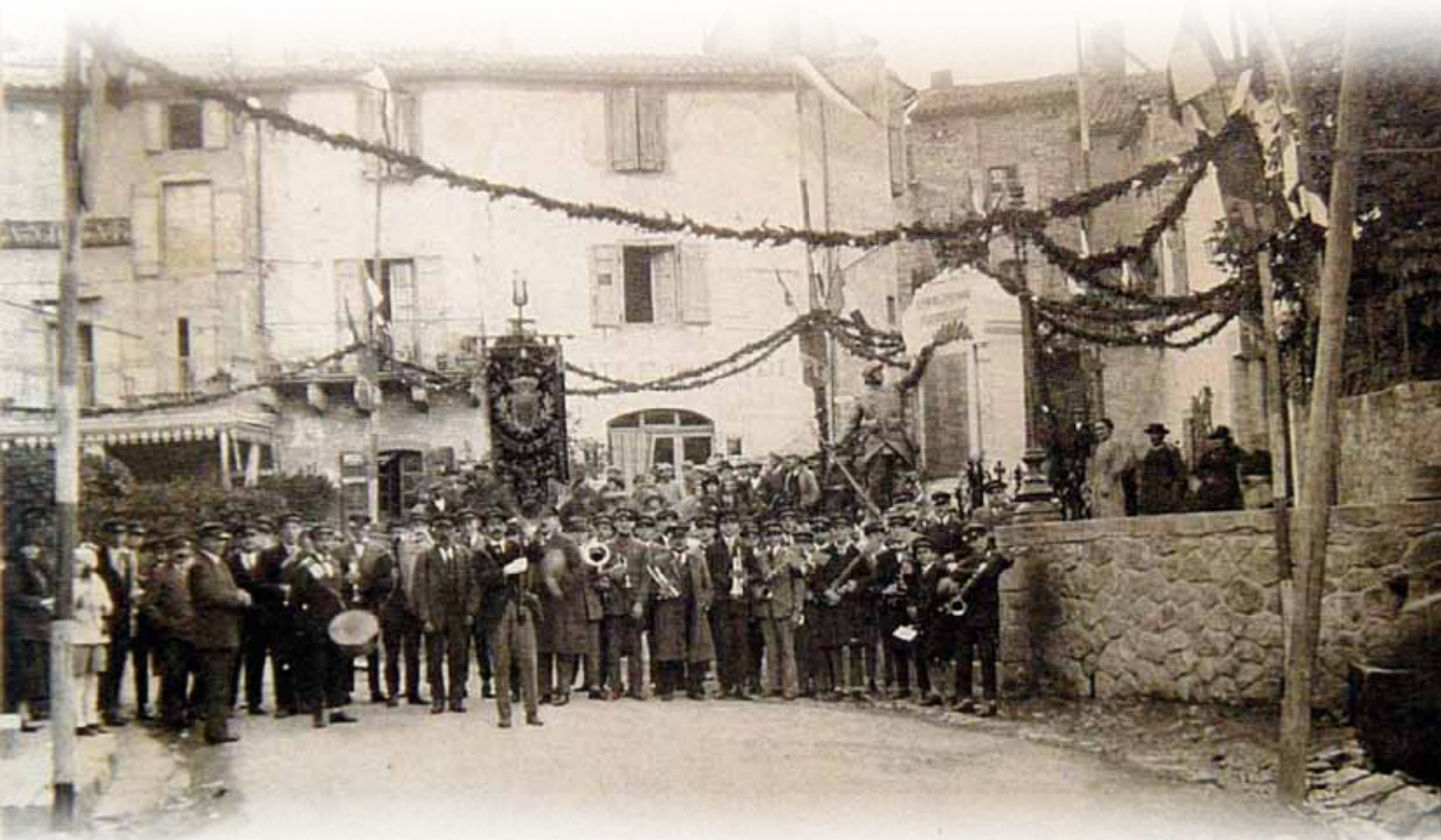
1925 : inauguration du Monument aux morts par Emile Borel, ministre de la marine et député-maire de Saint-Affrique.

Bulletin Paroissial « Chez Nous » du 9 novembre 1968