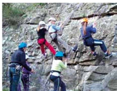
Les CM se sont initiés à l'escalade, en milieu naturel et sur bloc. Nous espérons poursuivre l'an prochain.

Les élèves d'élémentaire (CP, CE, CM) ont visité l'exposition sur la grotte Chauvet au musée de Millau. Ils ont bénéficié des interventions du CPIE (Centre permanent d'initiation à l'environnement) pour l'étude de l'écosystème du ruisseau avec une sortie sur le terrain au bord du Cernon.