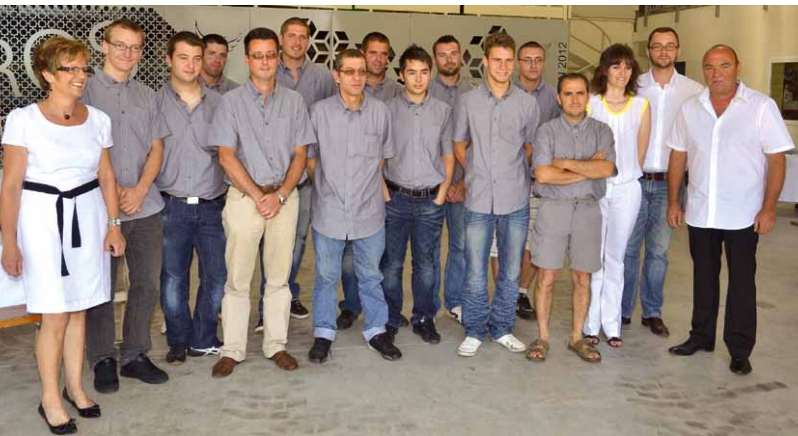
L'équipe de la métallerie Cros et Delmas.

Article paru dans le bulletin AVEYRON ECO. Édité par la CCI de l'Aveyron.