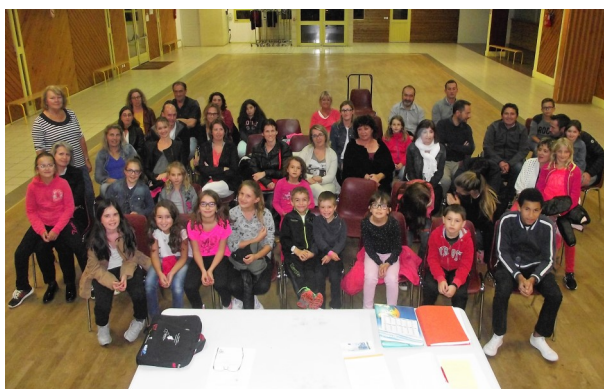
Lors de l'assemblée générale de début de saison

pour une soirée riche en humour et drôleries et où les rires seront garantis !