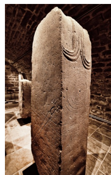
JLB stèle sépia light

Après avoir accueilli à plusieurs reprises la troupe de romains de la Legio VI Ferrata , puis l'an passé la troupe gauloise La Lance Arverne , il se murmure qu'une amicale confrontation des 2 troupes aurait lieu dans le parc du château de Montrozier cette année !