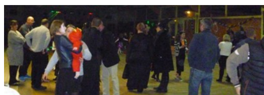
Ils sont arrivés !...