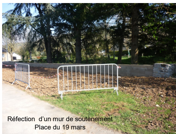
Réfection d'un mur de soutènement Place du 19 mars

Bâtiment de l'ancien camping : nettoyage des abords, mise aux normes pour la réouverture du bar.