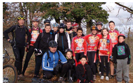
Compétiteurs Gageois avant le Régional à Sérénac (81)