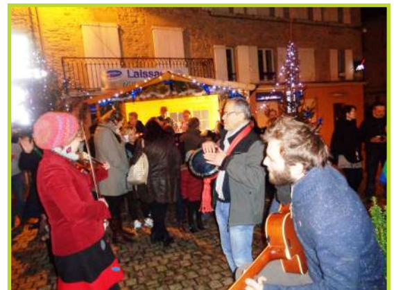
Vin chaud offert par l'UCAL