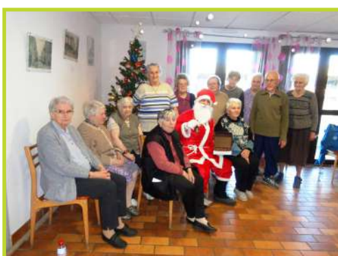
Le Père Noël pendant l'atelier bien-être à l'Oustal