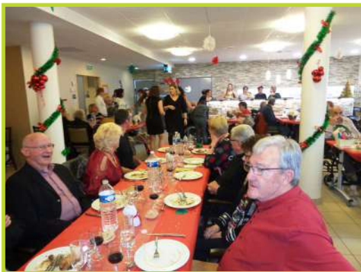
Repas de Noël à l'EHPAD