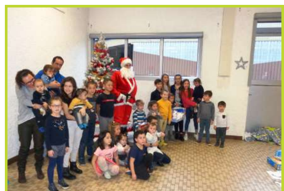
Le Père Noël chez les pompiers