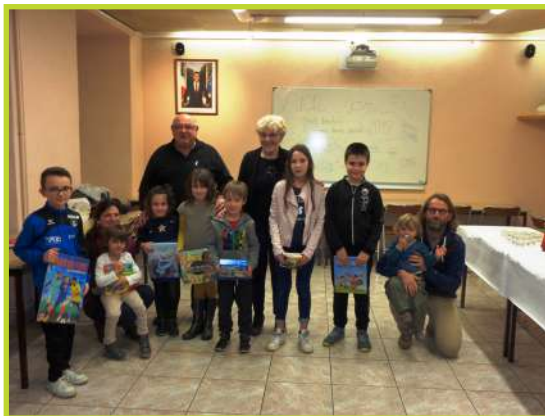
Le Père Noël pour les enfants du personnel communal