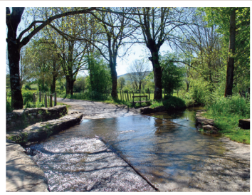
Passage à gué