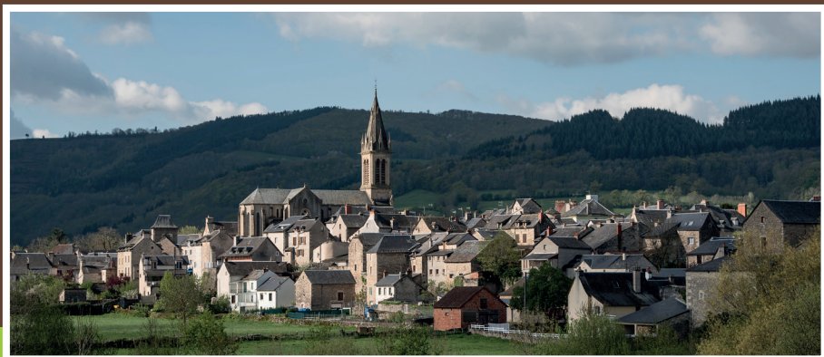
Village de Laissac