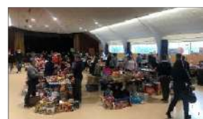
Bourse aux jouets

Toute l'équipe du Centre Social vous souhaite une belle année 2022 !