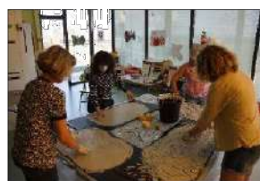
Formation créativité Relais Petite Enfance