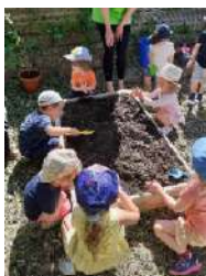
Atelier jardinage Multi-Accueil

Au CSPM, tout le monde a sa place ; toutes les activités sont envisageables selon vos idées !