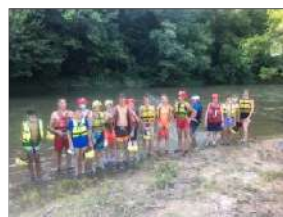
Sortie Club Ados