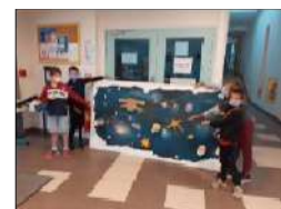
Fresque Accueil de Loisirs