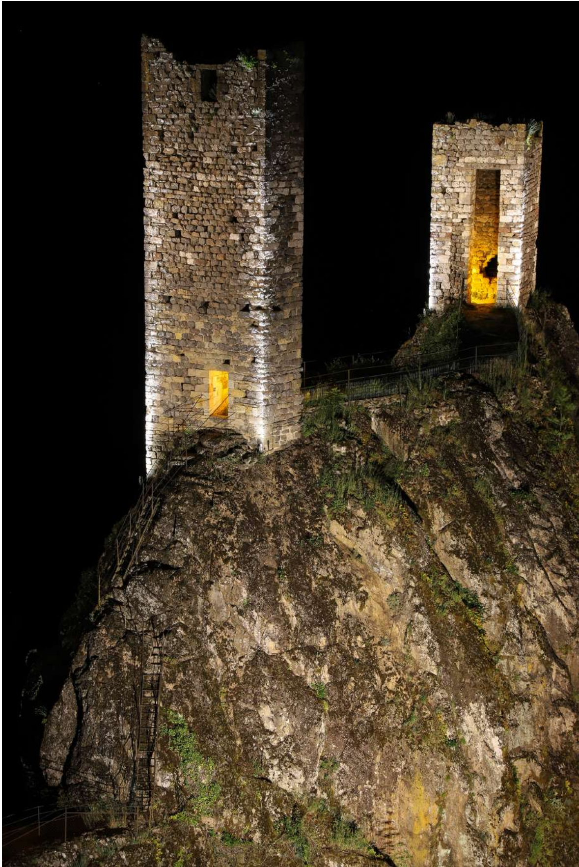
Tours illuminées de PEYRUSSE LE ROC