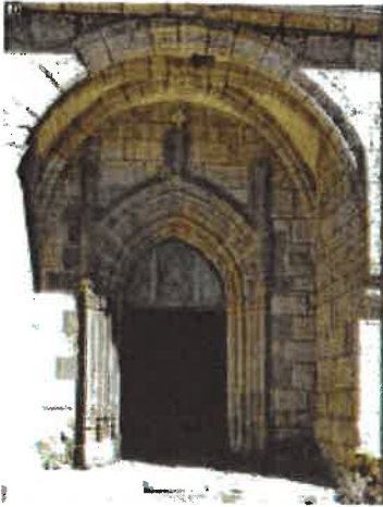
Intérieur de l'église de St Symphorien