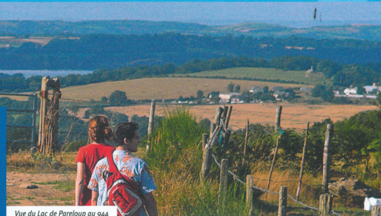
Vue du Lac de Pareloup au 944