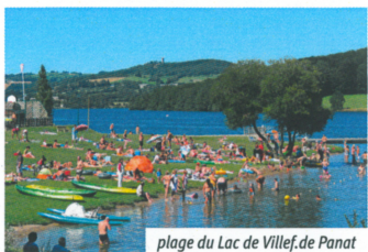
plage du Lac de Villefranche de Panat

capacité d'accueil, et leurs animations sportives et culturelles, les deux villages vous reçoivent dans les meilleures conditions, pour vous permettre de retrouver le calme et la sérénité !