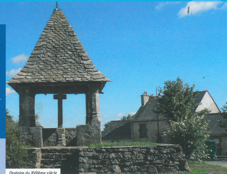
Oratoire du XVIIème siècle

1 Depuis la place du marché, prendre la route en direction de Rodez (D 25) sur environ 2,5 km (possibilité de suivre l'Alrance depuis les fontaines au cœur du village jusque sous le barrage, remonter ensuite sur votre gauche pour rejoindre le sentier aménagé en bordure du lac (laisser le mur du barrage sur votre droite). Poursuivre et tourner à gauche juste avant la passerelle métallique. Traverser le D 25 et prendre le chemin en face qui longe le ruisseau de la Niade puis se diriger vers le Viala.