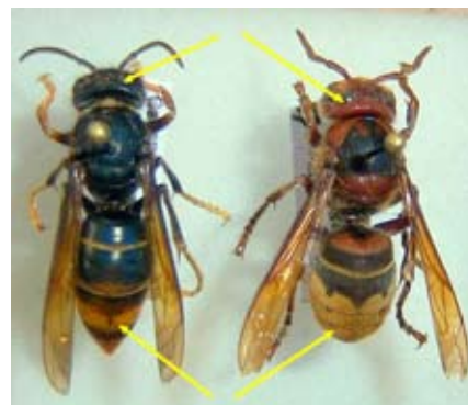
Comparaison entre le frelon asiatique (à gauche) et le frelon indigène (à droite).

En plaçant ces pièges dès le mois de mars et jusqu'à fin avril, les reines fondatrices peuvent être piégées. Mais à partir du 1 er mai il est préférable de les retirer car ils risquent de capturer de nombreuses espèces autochtones telles que frelons jaunes, guêpes, etc.